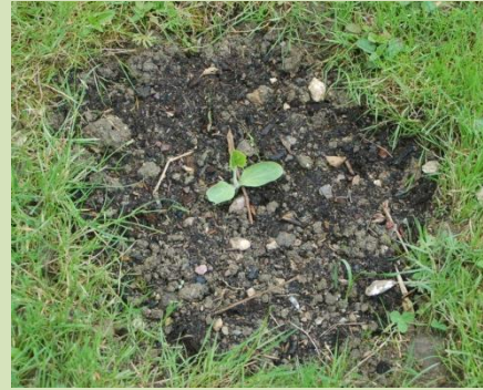
Sucrine du Berry et Laitue brune percheronne